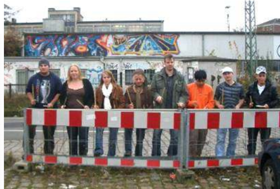
Harmonie im Chaos